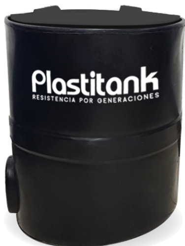
Caja de registro