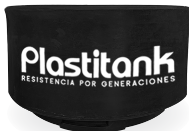
Extensión de la caja de registro